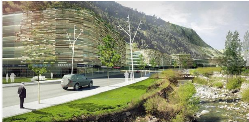
Una imatge virtual de la nova urbanització que se situarà a la carretera que connecta Encamp amb Escaldes-Engordany