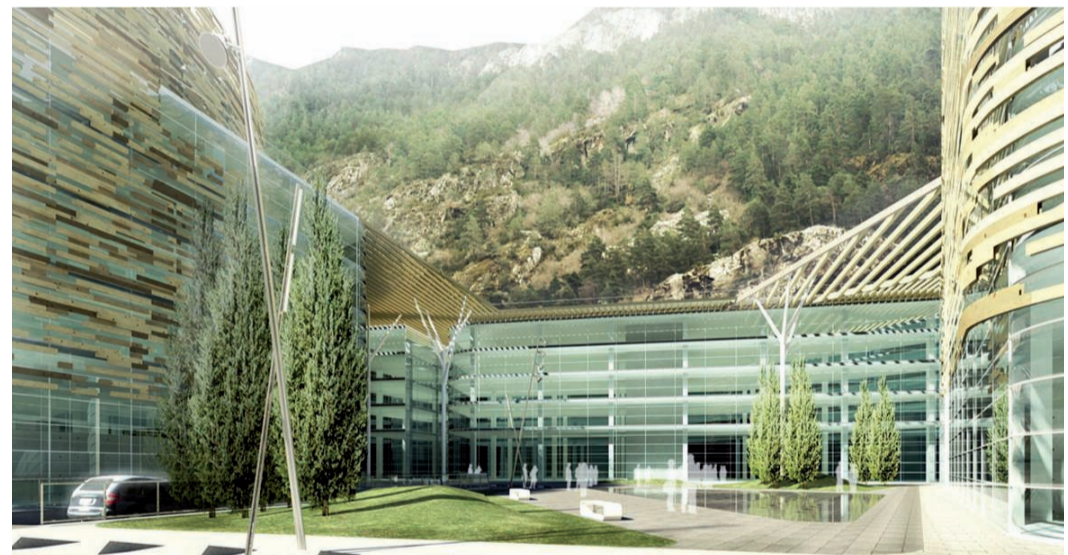
Imatges virtuals dels diferents espais que conformaran la nova urbanització que se situarà a la carretera que connecta Encamp amb Escaldes-Engordany.

El Comú aprova provisionalment un projecte d'iniciativa privada que transformarà el poble